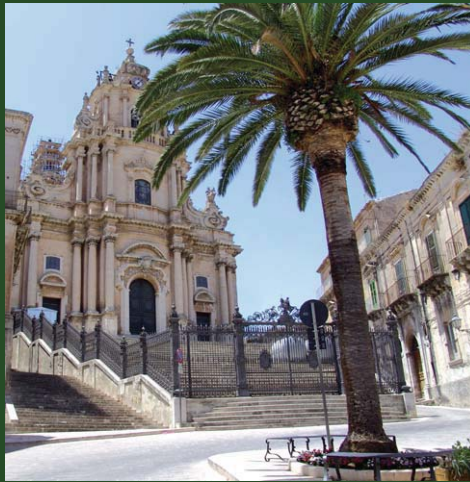
Duomo di San Giorgio a Ragusa Ibla

Baia Samuele Punta Sampieri, Ragusa 21-23 maggio 2009