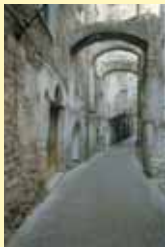
Arma di Taggia